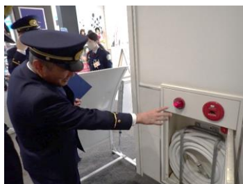
消防設備の不備がないかを確認しています。