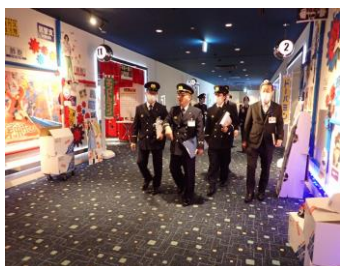
通路上に避難障害になるものがないかの確認中です。

令和6年12月11日、管内にあるエアポートウォーク名古屋で消防長特別査察を実施しました。年末の繁忙期に不特定多数の人が出入りする大型店舗などに対し立入検査を実施するもので、消防用設備や避難経路などに不備がないかを確認し、関係者に対しての火災予防の啓発を図ることができました。