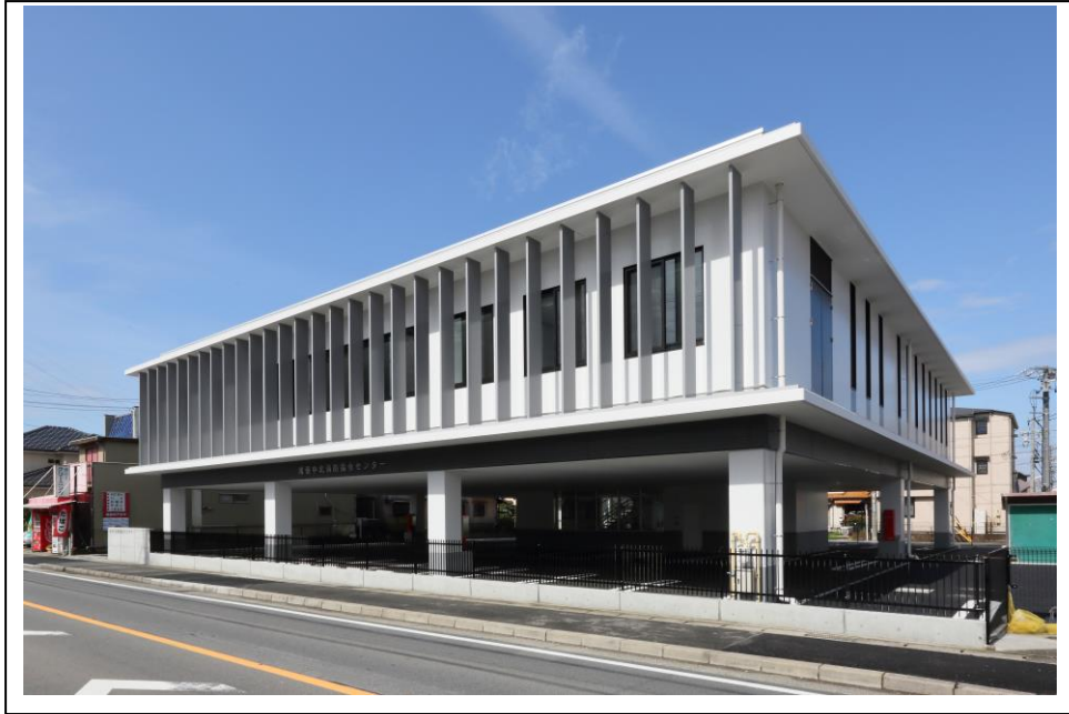
【尾張中北消防指令センター外観】