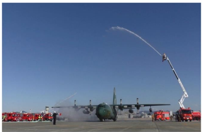
西春日井二市一町合同